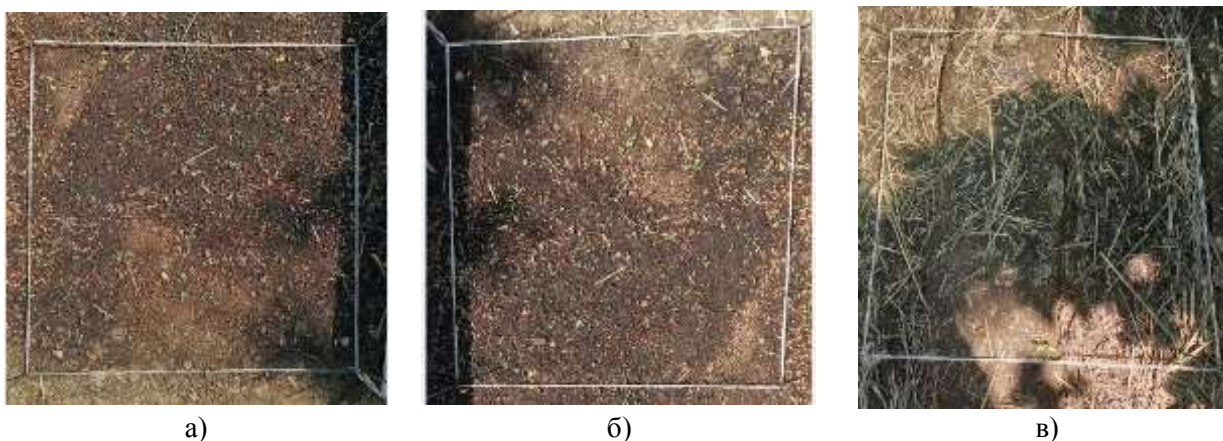
Сурет 3 – Салбыраңқы қайыңның 20 күндік өскіндері: а) бірінші нұсқа бойынша; б) екінші нұсқа бойынша; в) үшінші нұсқа бойынша

Тәжірибенің әр нұсқасында 3 қайталау болды. Көшеттер саны 1-кестеде, 3-суретте анық көрсетілген.