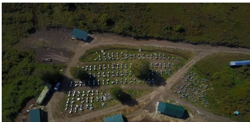
Сурет 4 – «Мед Алтайский» ш/қ базасында оқшауланған ұшатын жер

Оқшауланған ұшу жағдайында аналықтардың ұшуын жүргізу үшін оқшауланудың барлық талаптарына сәйкес келетін "Мед Алтайский" шаруа қожалығы таңдалды (сурет. 4). Шаруашылықтың ара шаруашылығы саласындағы басқа АӨК субъектілерінен қашықтығы 10 километрден асады. Шаруашылық асыл тұқымды, әр ара отбасына асыл тұқымды сертификаттары бар.