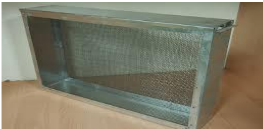
Сурет 1 – Аналықтарды отырғызуға арналған изолятор

Тазартылған ұяшықтары бар жақтау оқшаулағышқа орналастырылды (сур. 1), содан кейін аналықты салып, қақпағын жауып, оны ұяның ортасына орналастырдық. Аналықты 24 сағатқа қалдырылдырып, содан кейін оны изолятордан алып тастадық. Аналықтың салғаннан 4 күн өткен соң, жақтау изолятордан алынып, балауыз ыдыстарына дернәсілдерді қолмен егу жүргізілді. Жасушалардағы дернәсілдердің жасы бір күндік болды. Бұл дернәсілдерді қолмен егу процедурасы күн сайын жүргізілді.