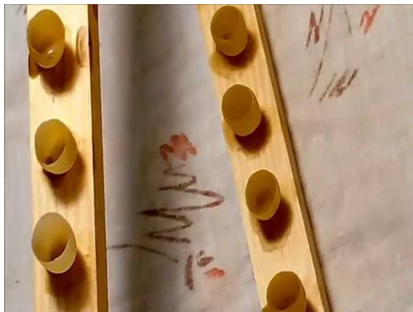
Сурет 2 – Дернәсілдерді егуге арналған балауыз тостағандар

Егу жақтауының тақтайшалары тостағандардың үстіне қойылды (сурет. 2). Әр ыдысқа бір тамшы бал салынып, оған себілген жасушадан дернәсіл шпательмен ауыстырылды (сурет. 3). Егу аяқталғаннан кейін егу жақтауының бүйір жолақтарының кесінділеріне тостағандары бар ағаш кесінділері бекітілген тақтайшалар енгізілді.