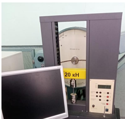
Рисунок 1 – Машина для измерения усилия резания обледенелых корнеплодов