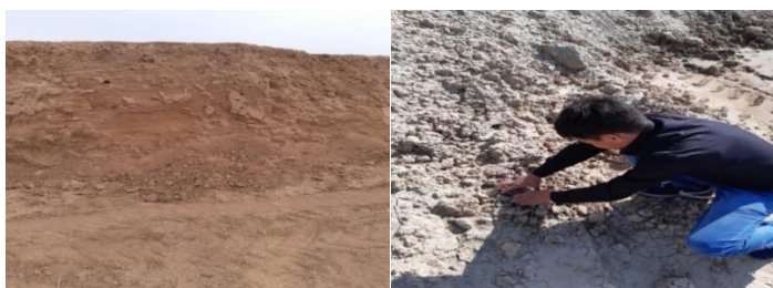
Сурет 1 - Батыс Қазақстан және Атырау облысының сары саздақ кен орындары

Саздардың химиялық құрамы мына аралықта болады (массасы бойынша): 45...80%-SiO 2 ; 8...28%-(Al 2 O 3 +TiO); 2...15%- FeO 3 ; 0,5...25% -CaO; 0,0...4%-MgO; 0,3...5%- R 3 O. Химиялық құрамының өзгеруі саздың қасиеттерінің өзгеруіне әсер етеді. Сазды минералдарда SiO 2 , байланыспаған Al 2 O 3 болуы саздардың байланысу қабілетін, күйдірілген бұйымдардағы кеуектілік есептерін, беріктілігін төмендетеді.